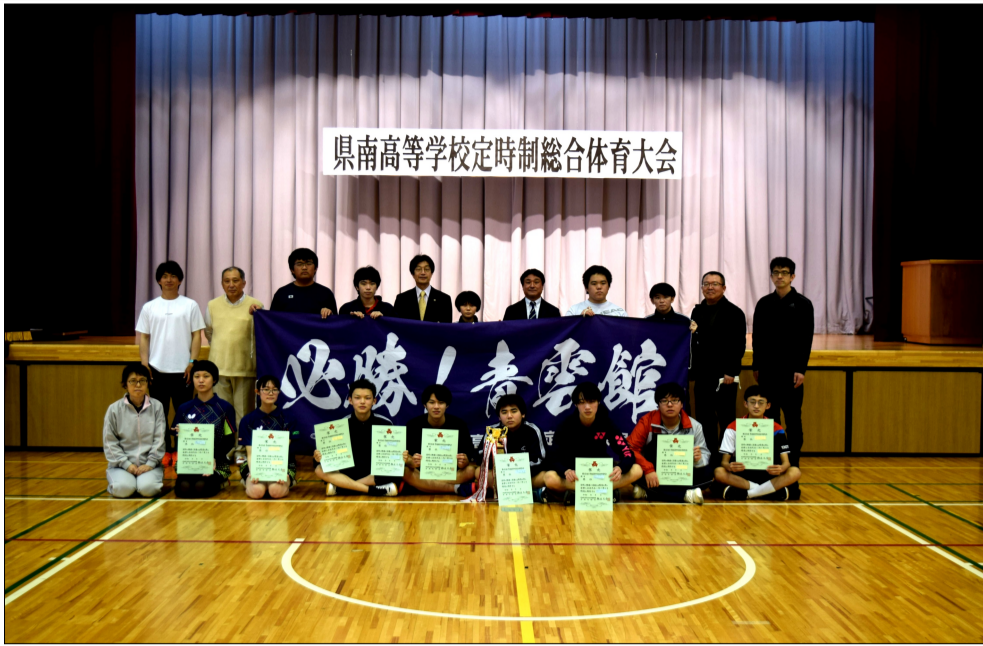
県南高等学校定時制総合体育大会

五月十四日(土)に、角館高校定時制の体育館にて県南定時制総体が行われた。本校からはバドミントン部、卓球部の他に今年はバスケットボール部も出場した。